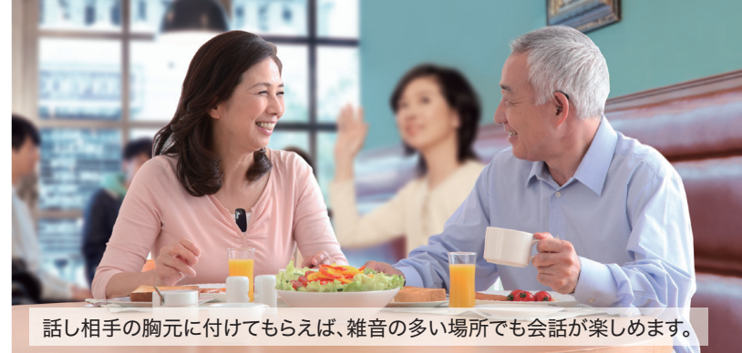
話し相手の胸元に付けてもらえば、雑音の多い場所でも会話を楽しめます。