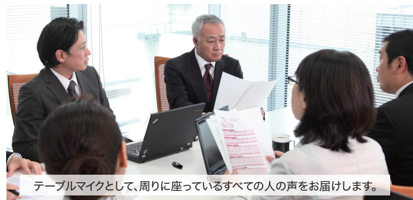
テーブルマイクとして、周りに座っているすべての人の声をお届けします。