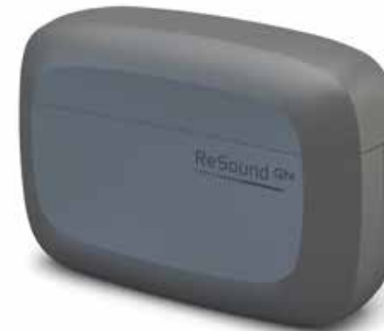
ReSound ONE Premium Ladeschale C-1