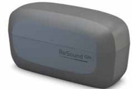
ReSound ONE Classic Ladeschale C-2